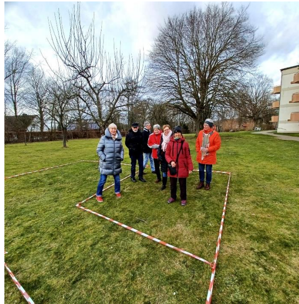
Endlich mal wieder ein Seminar! Unter 2G-Plus Bedingungen ging es um Wohnträume und Wohnmodelle und Wünschen in Theorie und Praxis! (hier vor dem Heinrich-Lübke-Haus),