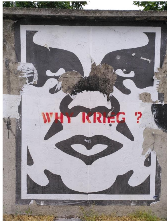
Foto: Mauer in Wien 2021