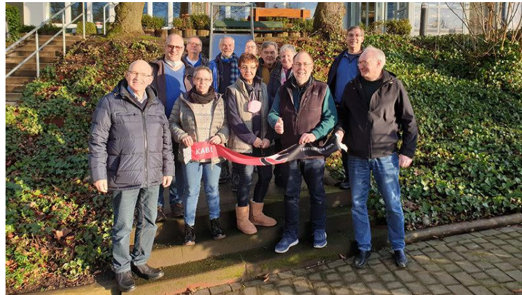
Das neu gegründete Netzwerk „Aktionen und Kampagnen“ der KAB im Bistum Münster.

In den nächsten vier Jahren beschäftigt sich der katholische Sozialverband mit dem Thema "WERTvoll arbeiten - menschenwürdig statt prekär". Die Netzwerk-Gruppe wird dafür konkrete Aktionen überlegen