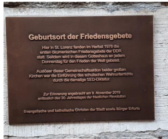
Friedensgebet Tafel in Erfurt

Kurze Texte und Bilder laden jede Woche ein, sich inmitten des Alltags eine kurze Auszeit zu nehmen.