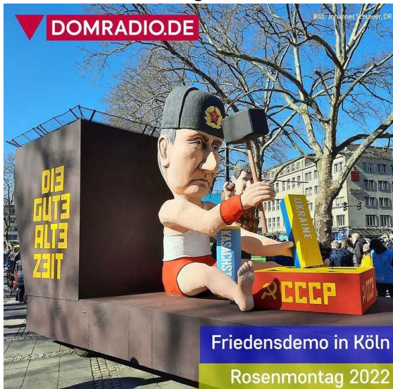
Friedensdemo in Köln Rosenmontag 2022

„Kann etwa ein blinder Mensch einen blinden Menschen führen?“ (Lk 6, 39) Ein klares Nein dazu. Eine gute und gedeihliche Lebens-Füh- rung gelingt nur im wechselseitigen Helfen und Führen, Lenken und Leiten bei in Gänze akzep- tierter und fruchtbar gemachter Unterschied- lichkeit; ressourcen- und charismen-, kompe- tenzen- und fähigkeitenorientiert; Einheit in bunter Vielfalt und zwar auf dem Fundament von Recht und Gerechtigkeit, Frieden und Liebe, Souveränität und Bindungsfähigkeit, In- dividualität und Gemeinschaftssinn. Niemand kann alles, und niemand kann nichts. Und alle haben die gleiche unantastbare menschliche Würde und ein uneingeschränktes Recht auf