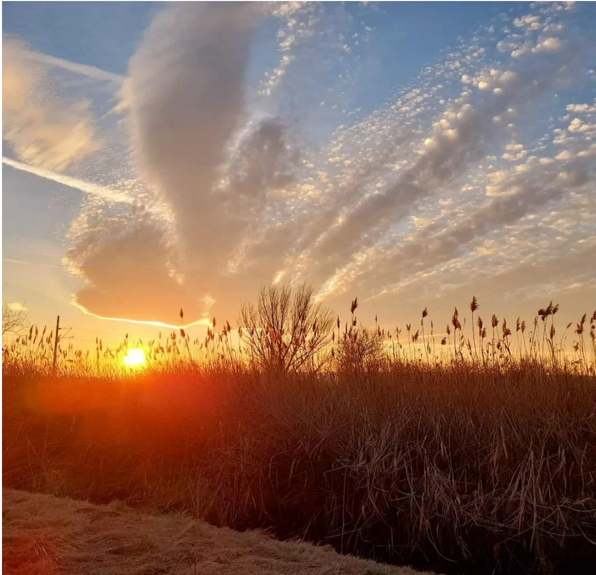
Sunset am See

Wenn die Hoffnung schmale Wege, neue Möglichkeiten findet, und trotz vieler Hindernisse, in ein Meer voll Liebe mündet. Zweifel sich zu Klarheit wendet, Bitterkeit dem Frohsinn weicht, Glücklichsein sich zart vollendet, ist das große Ziel erreicht.